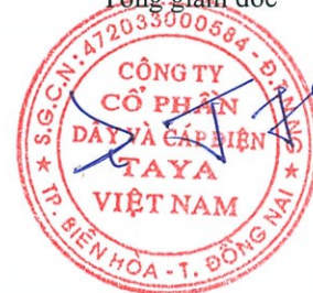
WANG TING SHU