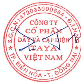
WANG TING SHU